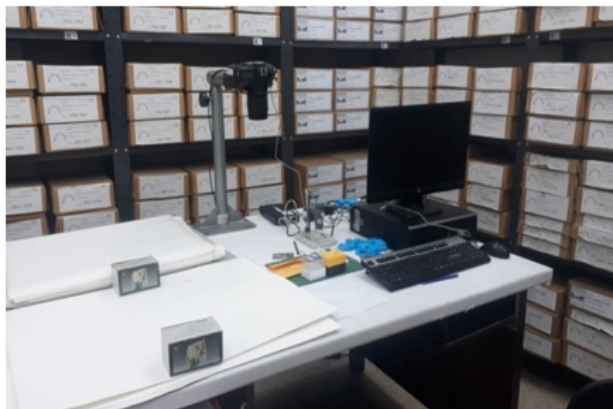
Laboratorio de Digitalización

En el Laboratorio de Digitalización del Archivo de la Paz se realiza el proceso de conversión de documentos analógicos históricos en soporte de papel a formato digital. Esta acción contribuye a la conservación y preservación de las piezas, evitando la manipulación de los materiales originales.