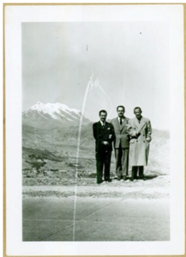
ALP : Colección fotográfica histórica (1846-1999)